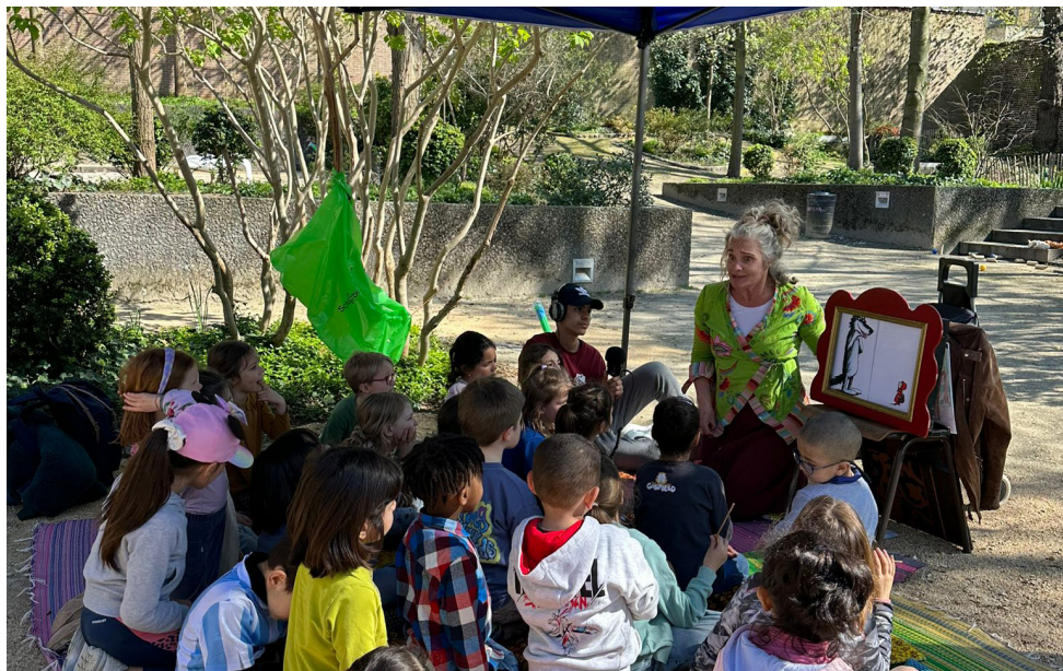
Une petite sortie...