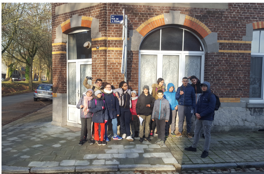
Jeu de piste à Ath pour le groupe des grands