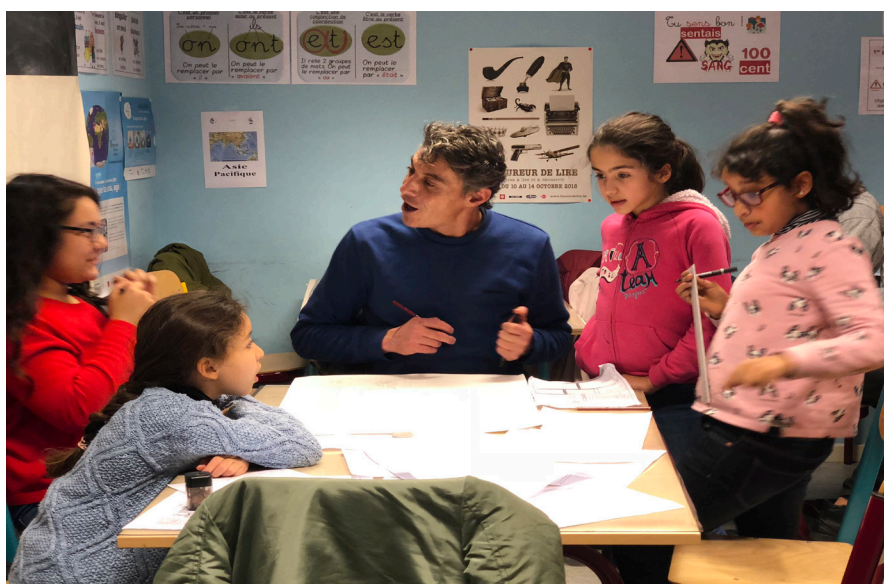
Atelier de création d'une bande dessinée pour les Castors