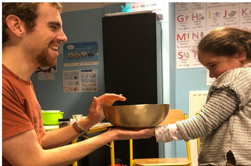
Découverte instrumentale du Bol Tibétin chez les Juniors...