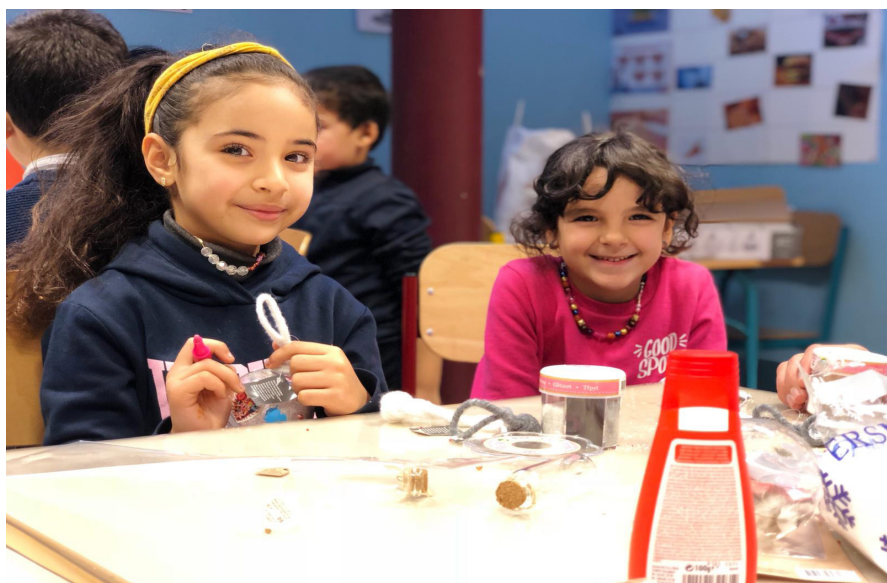
Bricolage boule de Noël suite