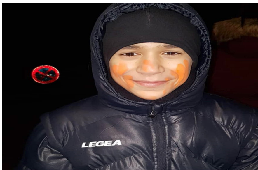
Anas: Un samedi spécial jeu de nuit chez les Grands