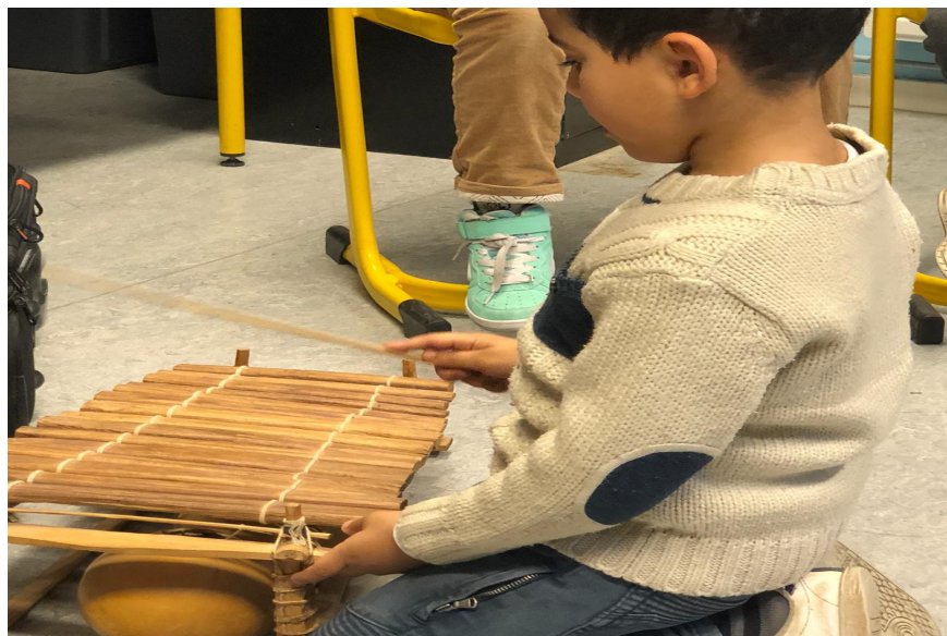
découverte instrumentale suite