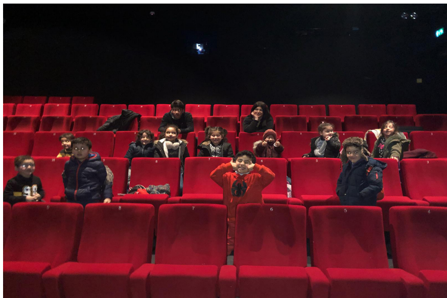
Sortie au cinéma dans le cadre de notre projet d'initiation aux arts