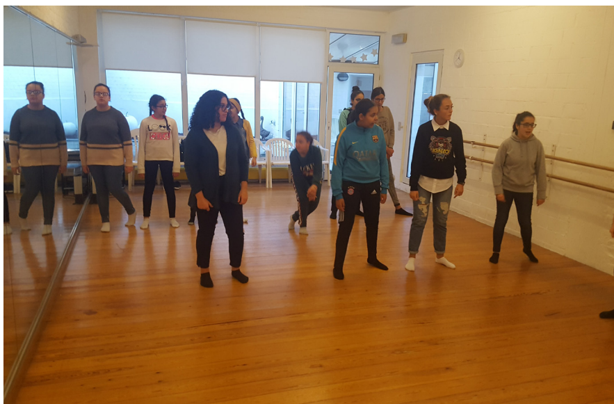
Atelier danse avec les grands