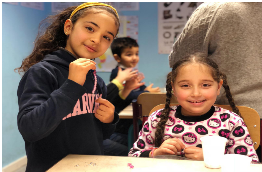
Bricolage boule de Noël avec les Juniors