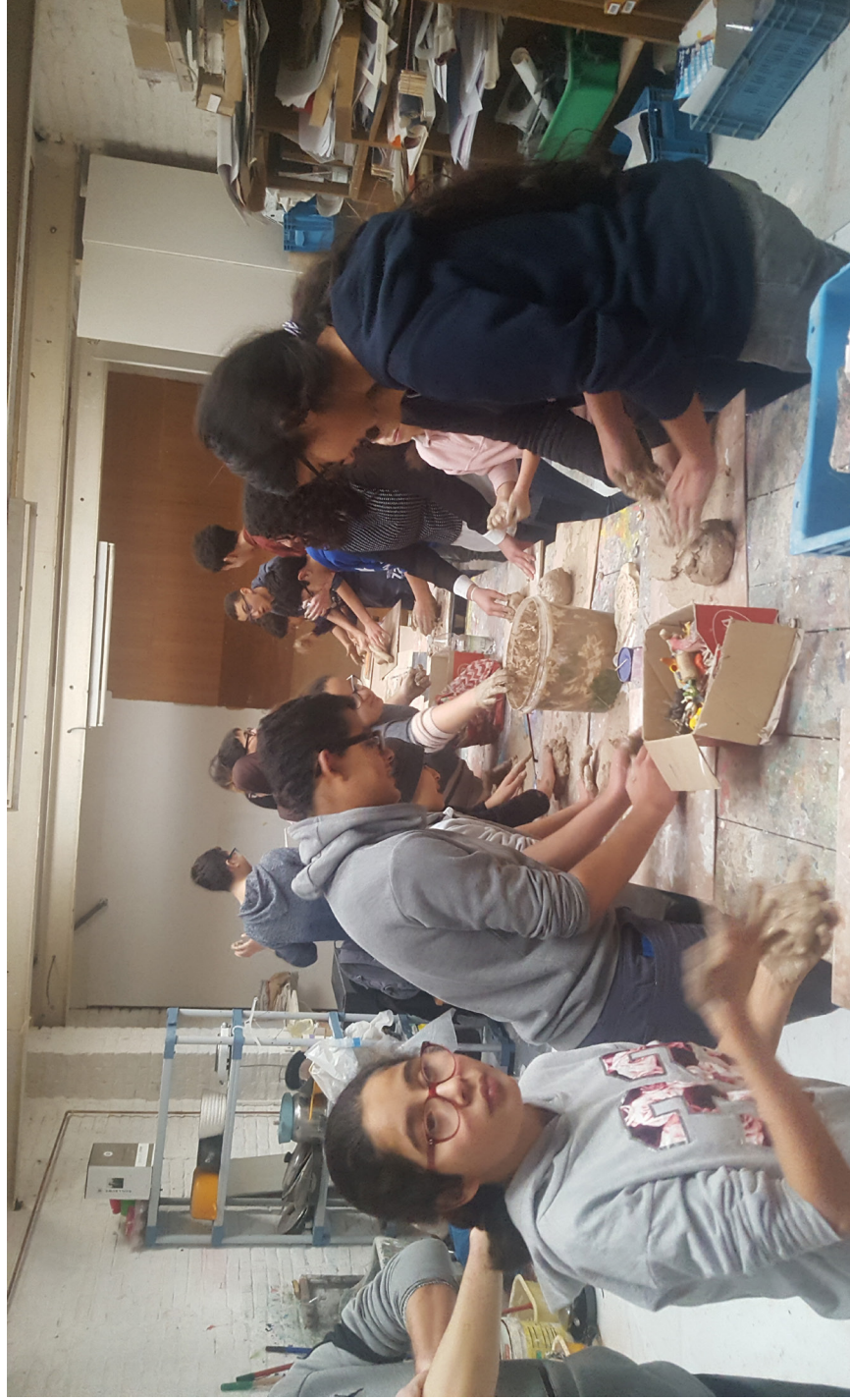
Initiation à la sculpture pour le groupe des grands.