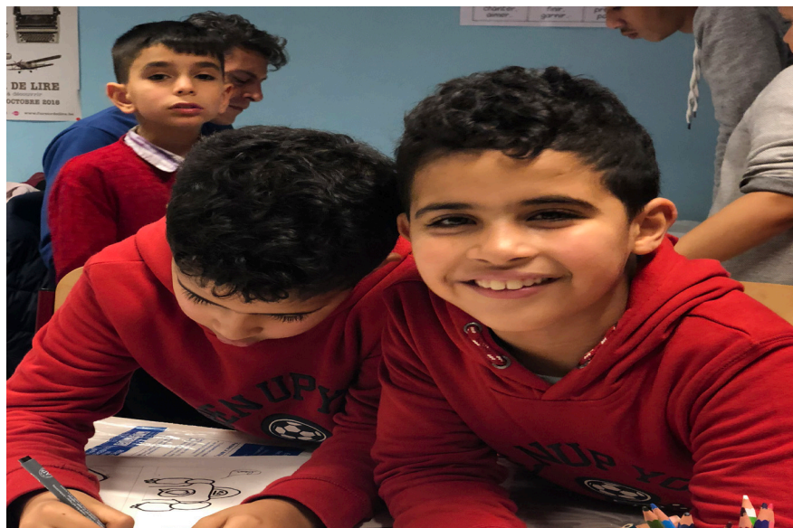
Les castors en pleine création de planches de bande dessinée